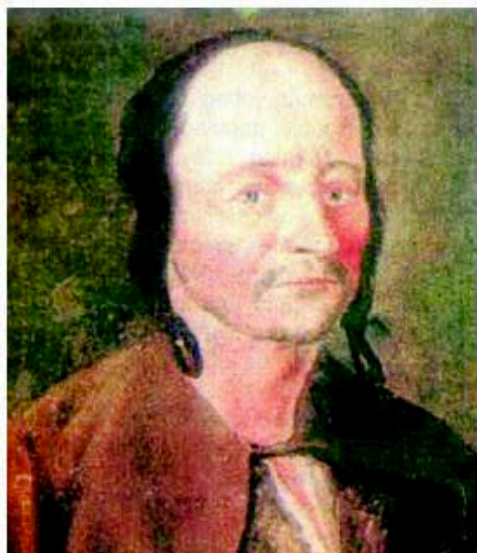
Vasile Ursu Nicola (Horea)