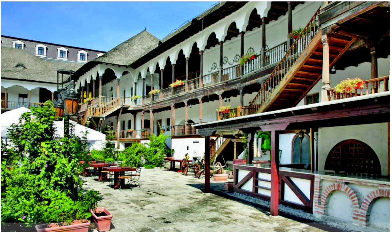
Hanul lui Manuc

Spre sfârșitul veacului al XVIII-lea și în primele decenii ale celui următor au început să pătrundă în spațiul românesc, cu oarecare timiditate, primele influențe vest-europene în ceea ce privește vestimentația, arhitectura și viața socială.