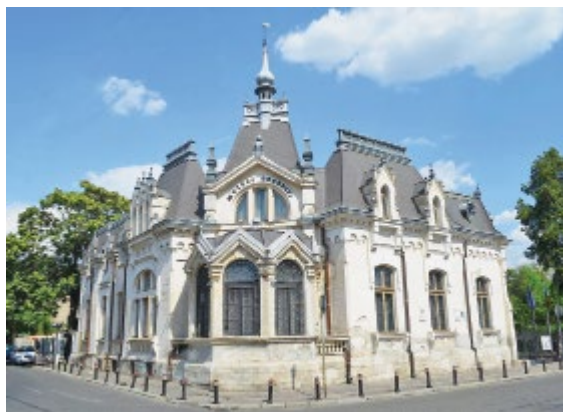
Casa „Luca Elefterescu”, azi Muzeul Ceasului „Nicolae Simache”

„Zilele sunt egale pentru un ceasornicar, dar nu pentru un om”