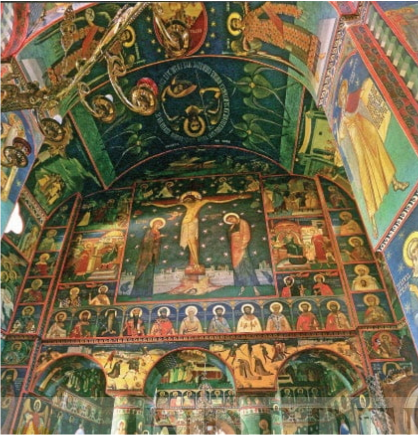
Naosul și pronaosul Catedralei Izvorul Tămăduirii - vedere spre vest