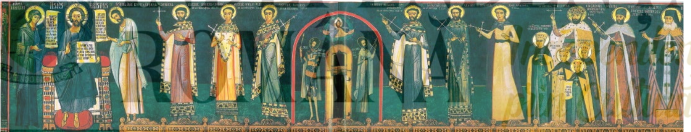
Compoziția Deisis în absida de sud a naosului. Face parte din ciclul Sfinților Mucenici români în puternică rugăciune