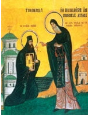
Tunderea în monahism a Sfântului cuvios Paisie