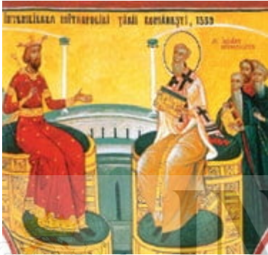
Întemeierea Mitropoliei Țării Românești în anul 1359. Domnitorul Nicolae Alexandru Basarab și Sfântul Iachint Mitropolitul