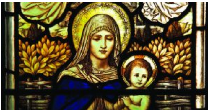
Cercetările teologice asupra afirmațiilor că