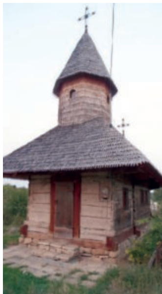
Biserica de lemn „Cuvioasa Paraschiva, după lucrările de restaurare din 2007