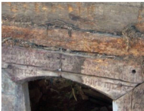
Pisania bisericii „Cuvioasa Paraschiva” din Bujoreni