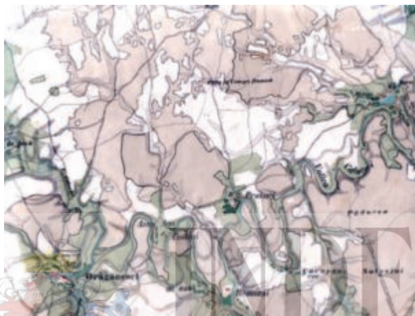
Harta României meridionale 1860

Comuna Bujoreni formată din satele Bujoreni și Prunaru este amplasată în partea estică a județului Teleorman pe valea râului Câlniștea, la 53 km de București și 30 km de Alexandria. Satul Bujoreni, centrul comunei cu același nume, este cunoscut în epoca medievală sub numele de satul lui Costea apoi de Costieni iar la sfârșitul epocii medievale și începutul epocii moderne sub numele de Asan Aga. Documentele referitoare la satul Costieni sau Asan Aga din 1744 din județul Vlașca sunt prezentate în Indice cronologic nr. 2, Episcopia Argeșului . Cel mai important element care definește fizionomia acestora este așezarea geografică, pe valea Câlniștei afluent al Argeșului. Peisajul geografic dominat de râul Câlniște prezintă o luncă cu păduri de stejar pe partea dreaptă a cursului. Râul prin îndiguirii a creat iazuri care se întind între satele Bujoreni, Râsuceni, Prunaru și Bila.