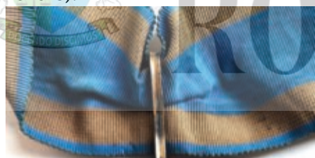
Ordinul „Coroana României” în gradul de Comandor (avers și revers).

„Decorația acestui Ordin este o cruce cu ramuri egale; fiecare ramură e de smalt roșu, având împrejur o dungă albă; între ramuri e cifra regelui. În mijlocul crucii e un medalion cu două fețe: partea de deasupra conține Coroana Regală de oțel, pe smalt roșu; împrejur, pe un cerc de smalt alb, e scris, în partea superioară: PRIN NOI ÎNȘINE, și, în partea inferioară, 14 MARTIE 1881. Reversul medalionului poartă scris la mijloc, pe smalt roșu: 10 MAIU; și împrejur, pe un cerc alb: 1866, 1877,