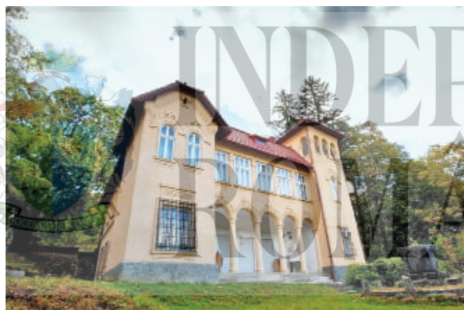
Castelul de la Ciucea

Vinerea Patimilor, pe înserate... Din biserica satului, unde s-a săvârșit stujba îngropării lui Iisus, țărani ies pâlcuri, amestecați bărbați și femei, păstrând după vechiul obicei toată rânduiala ierarhică. Dinspre pădurea de fagi unde s-a prălvălit soarele, coboară umbre cernind culmile și prin sita lor, răzleț, licurici tremurători se ivesc împrejur. Sunt lumînările care se aprind la morminte, când deodată ca un vaiet subteran începe pe la poalele crucilor recitativul monoton al bocetelor muieresti. Bărbații tac duși pe gânduri, cu buzele strânse, cu fruntea plecată, purtați parcă de valul tânguirii, copiii privesc speriați în lături, satul întreg s-a cufundat în convobire cu morții... La răspântia uliței, coborând spre casă, mă mai opresc o dată în drum și cum privesc înapoi, țintirimul îmi răsare în amurgul târziu semănat cu limbi de flăcări gălbui-albastre, cuprinzând din toate părțile trupul bisericii într-o cunună de foc ca o aureolă ... Ajuns la casa mea din capul satului, mă mai urmăresc încă de departe aduse pe vântul moale de seară frânturi din colocviul cu cei de sub pământ, în vreme ce m-așez pe scaunul de pe prispă cu mintea răscolită de problemele vieții de la țară.