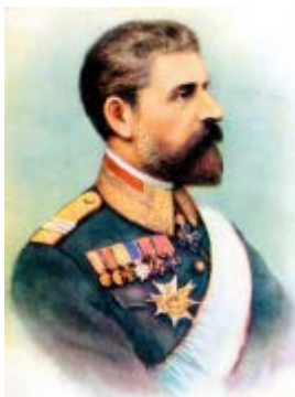
Regele Ferdinand I