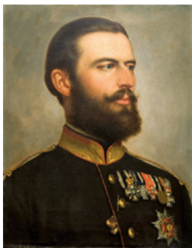
Regele Carol I

Din multitudinea evenimentelor marcante, de la venirea Principelui Carol până la abdicarea Regelui Mihai, am ales câteva momente din începutul sovietizării României și sfârșitul monarhiei în țara rămasă fără Basarabia. După Actul de la 23 august 1944, Armata Regală Română a început ofensiva pentru eliberarea Transilvaniei, alături de Armata Roșie, care se comporta ca ocupantă (!), guvernul Sănătescu a trimis la Moscova o delegație (compusă din L. Pătrășcanu, Ghiță Pop, Barbu Știrbey și Dumitru Dămăceanu) pentru a semna Convenția de armistițiu cu Națiunile Unite, în care, printre altele, România era obligată la despăgubiri de război, în valoare de 300 de milioane de dolari (în special către U.R.S.S.) și la participarea cu cel puțin 12 divizii împotriva nazismului. Ofensiva noastră a dus la izgonirea forțelor hitlerist-horthyste de pe teritoriul românesc; în dimineața de 25 octombrie 1944, Careiul a fost eliberat, ca un omagiu adus Regelui Mihai, suveranul țării și capul oștirii, de ziua sa de naștere (1921).