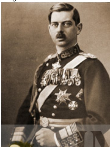
Regele Carol al II-lea